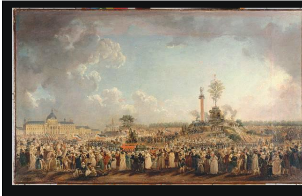
Afb. 3: Op 8 juni 1794 werd een feest gehouden ter ere van de cult der superieure wezen (plaats onbekend).

Factoren die de Franse Revolutie vormden, kwamen voort uit veranderingen in de structuren van klassen, maar ook door de verandering van politiek-culturele structuren. 32