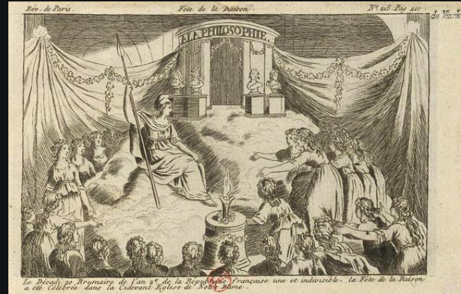
Afb. 1: 'Fête de la Raison' in de Parijse Notre-Dame, 10 november 1793 (Décadi 20 Brumaire, jaar 2 volgens de republikeinse kalender).