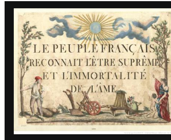
Afb. 4: 'Het volk van Frankrijk erkent het superieure wezen en de onsterfelijkheid van de ziel'. Bron: Bibliothèque nationale de France, département Estampes et photographie, https://bit.ly/3Krkvt8 .

'verrader van de revolutie' werden aangemerkt, zag de aanhangers van de ontkerstening juist als wrede katalysator voor georganiseerd geweld. Hij vreesde een georkestreerde contrarevolutie door 'atheïstische aristocraten' en hun 'wil de revolutie te verzwakken'. 39 Daarom wilde Robespierre dat Frankrijk haar christelijke geloof behield.