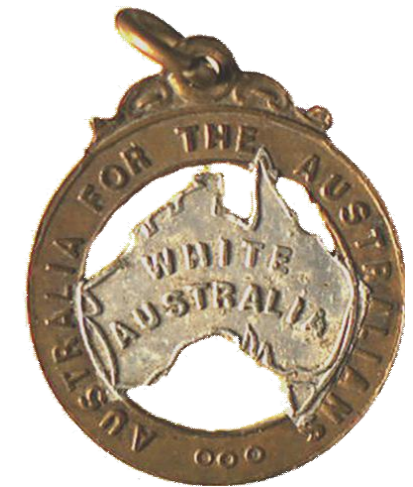
Afb. 2: Badge met de tekst 'White Australia'. Dit soort badges werd aan het begin van de twintigste eeuw gedragen door witte Australiërs.

Eerstegeneratie-Windrusher en historicus Mike Phillips beschrijft in een interview hoe, voor zijn aankomst, de kranten inderdaad positief schreven over de immigratie van de zwarte bevolking. 17 Hij zegt dat men hun niet veel aandacht schonk, aangezien er in die tijd ook migranten uit Europa het land binnenkwamen. Immigratie waren ze dus wel gewend. The Sphere meldde in 1954 dat er tussen januari en oktober ruim 8000 zwarte immigranten waren aangekomen in het land. Het precieze aantal weet de krant niet, want 'zowel West-Afrikanen als West-Indiërs zijn Britse burgers en er is geen officiële controle bij hun aankomst in Groot-Brittannië'. 18 Wegens het grote aantal migranten dat in een keer arriveerde, was er af en toe onrust. Toch gedroegen de migranten zich over het algemeen goed en werkten ze hard, schrijft de krant. The Scotsman schrijft hoe de