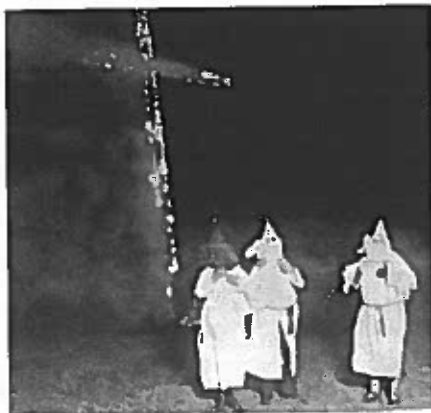
Een bekend beeld van de Ku Klux Klan

Het kwaad spreekt tot de verbeelding. Licht huiverend begeben we ons in de meest duistere spelonken van de menselijke geest en geschiedenis, hopend om de volgende hoek nog grotere gruwelijkheden aan te treffen, terwijl we tegelijkertijd nauwelijks durven te kijken – alsof we in de bioscoop zitten bij een griezelfilm. Over geschiedkundige interpretaties valt te twisten, maar de wandaden die uit naam van het Derde Rijk zijn begaan scoren hoog in de top tien van historische horror. Vergeleken met de nazi's lijken de leden van de tweede Ku Klux Klan een stel-