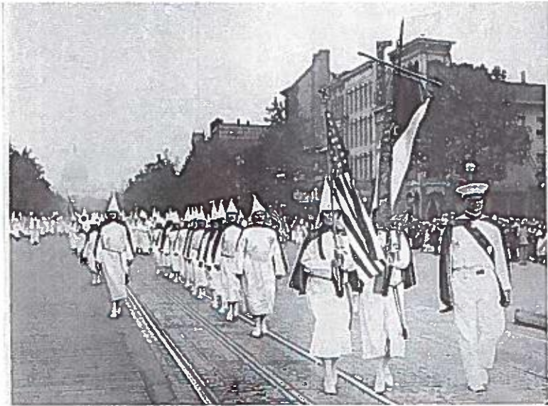
Een demonstratie van de Ku Klux Klan in Washington in 1928

lokale afdelingen van de Klan betwisten voortdurend het gezag van de mannen aan de top.