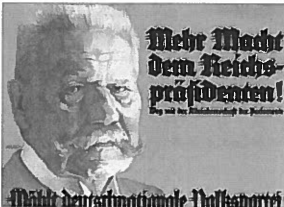
'Mehr Macht dem Reichspräsidenten! Weg mit der Alleinherrschaft der Parlamente' Verkiezingsposter uit 1932