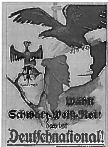
Een verkiezingsposter van de DNVP uit 1924

(DNVP) enerzijds en de NSDAP en haar voorlopers anderzijds, zal ik aangeven hoe de nazistische partij in het interbellum de traditionele aanhang van de conservatieve partij overnam. Hierbij speelt de mediamaagnaat Alfred Hugenberg, die in zowel de 'Völkische,' dat wil zeggen, ultranationalistische en antisemitische, als de conservatieve beweging belangrijke posities innam, en die als leider van de DNVP deel uit zou maken van Hitlers kabinet. Tot slot volgt een korte behandeling van gezamenlijke kenmerken van beide ideologieën.