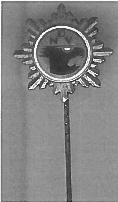
Lidmaatschapspeldje van de DNVP

Rond de eeuwwisseling werd tal van pogingen ondernomen Duitsland van een koloniaal rijk te voorzien. Op de nederlaag van 1918 volgden nieuwe plannen om meer rijkdom, prestige en invloed voor het Duitse volk te verkrijgen.