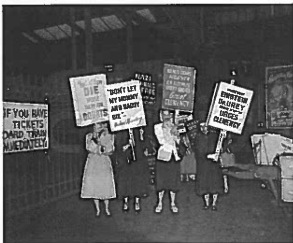
Een Amerikaans protest tegen de executie van de Rosenbergs