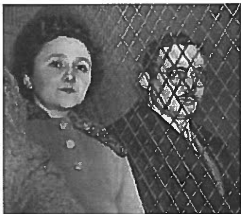
Ethel en Julius Rosenberg

De profetieën van de Britse ambassadeur zouden niet uitkomen. Nederland was wel degelijk doordrongen van het rode gevaar. Vanaf 1946