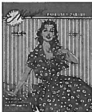
Een Margriet uit 1957

en in een moraal op basis van algemeen-christelijke waarden, vooral in de adviesrubriek 'Margriet weet raad'. Van Eysden probeerde in 'Margriet weet raad', waarvoor ze tot 1962 brieven beantwoordde, echter ook een voorhoederol te vervullen: zij plaatste bijvoorbeeld brieven over ongehuwde moeders en driehoeksverhoudingen. Hierdoor kwam zij in aanvaring met de katholieke hoofdredacteur en de uitgeverij, die van mening waren dat zulke problemen niet in een damesblad thuishoorden. Van Eysden stelde zelf ook beperkingen aan de inhoud van de adviesrubriek. Seksuele problemen kwamen er bijvoorbeeld niet in.