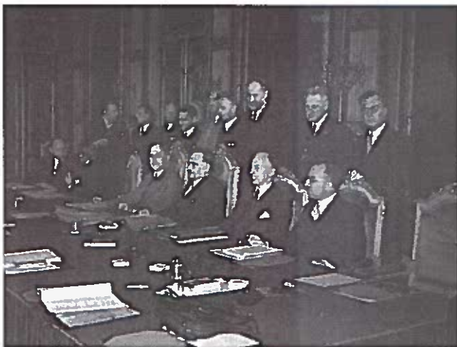
De leden van het tweede kabinet-Drees, onder wiens leiding de AOW tot stand kwam

Drees had het goed gezien: het duurde inderdaad negen jaar voordat de noodwet-Drees vervangen werd door een permanente ouderdomsregeling.